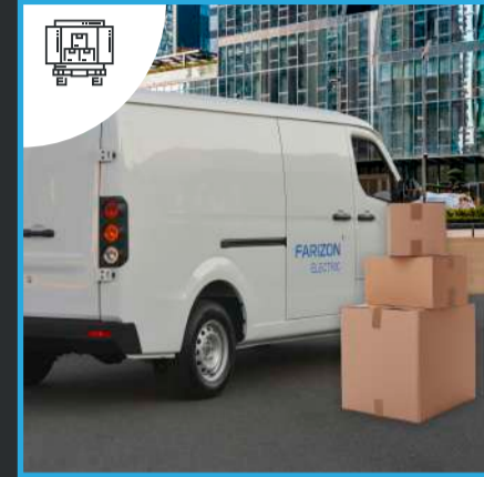
Capacidad de Carga de 1.500 Kg y volumen de 6 m 3 .