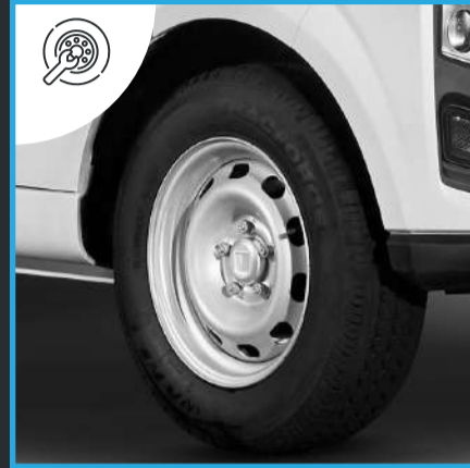
Rueda de Repuesto.