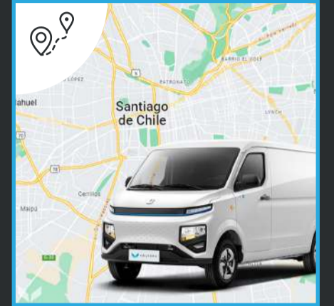
Autonomía real de 200 Km.